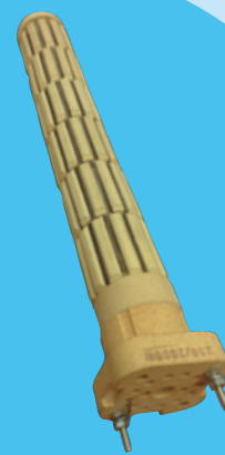
Suché keramické teleso